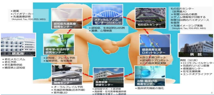
国立長寿医療研究センター：心と体の自立を促進し健康長寿社会構築に貢献 心と体の自立阻害要因を抽出、医学的、社会的な解決策を創出